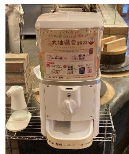
画像は昨年イベントの様子