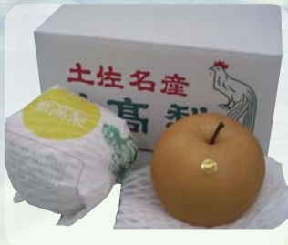
【高知県】 高知県産 新高梨 (3玉/約2.4kg)