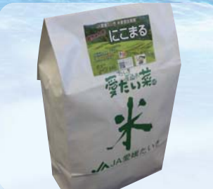
【愛媛県】 愛媛認証米 にこまる (5kg/1袋)