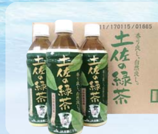
【高知県】 土佐の緑茶ペットボトル (500ml×24本)