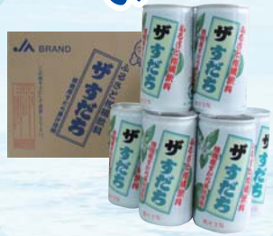
【徳島県】 柑橘ドリンク ザすだち (190g×30本)