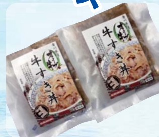
【香川県】 香川県産 オリーブ牛 牛すき丼の具 (牛丼130g×2袋/冷凍)