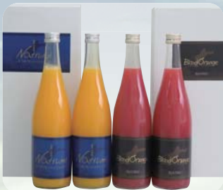
【愛媛県】 ブラッドオレンジジュース/ なつみジュース(720ml瓶×2本入×各1箱)