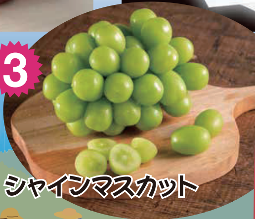
3 シャインマスカット