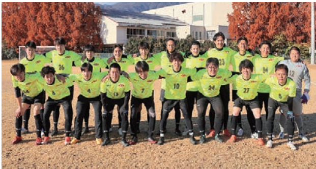
JA全農やまなしサッカー部

第20回山梨県JAグループ親善サッカー大会が12月7日、韮崎市のグラウンドで開催され、県内8チームが参加しました。JA全農やまなしはJA梨北と対戦。攻守にわたり最後まで互いのチーム力が拮抗し、0対0で試合を終えると、勝