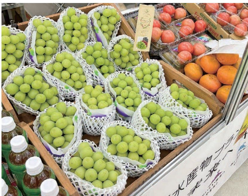
今年も大好評の山梨県産青果物