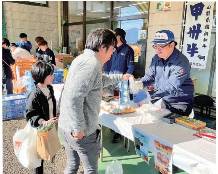
甲州牛ライスバーガーを購入する来場者

また、生産者の方々にご協力いただき、来場者を対象に山梨の銘柄牛アンケートを行い、甲州牛と甲州ワインビーフの知名度調査および知名度向上のためのPRも行いました。アンケートはおよそ120名の来場者にご協力をいただき、ご協力いただいた方には神セブングミを1袋プレゼントしました。