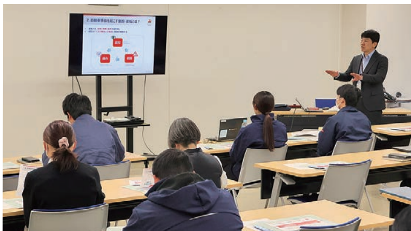
講習を聞く職員たち