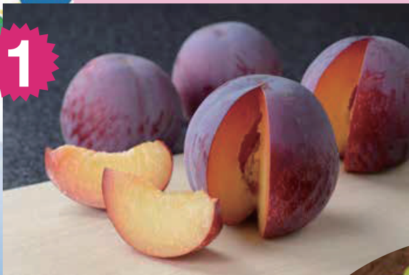
1 すもも 貴陽