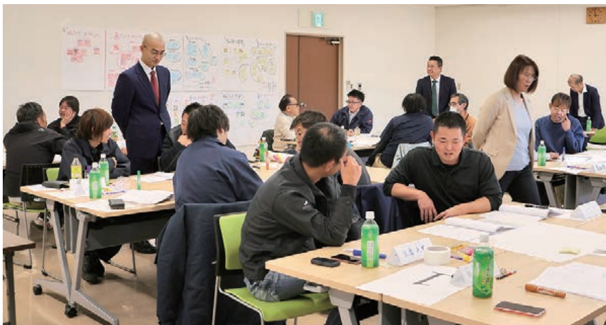
討論する参加者たち

農機担当者は修理整備業務が主体となっており、今回のように推進業務やコンプライアンスについて学ぶ機会が少ないため、JAから相談を受けていました。JA農業機械担当者のスキルアップの機会となるよう、今後も継続的な開催を検討しています。